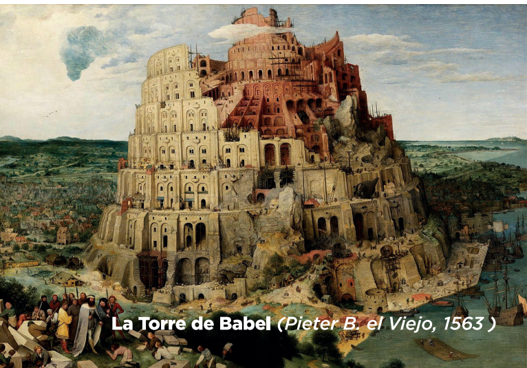
La Torre de Babel (Pieter B. el Viejo, 1563 )

11 sesiones – Un viaje bíblico que conecta el principio de la historia con tu vida hoy.