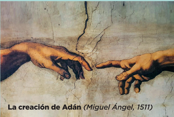
La creación de Adán (Miguel Ángel, 1511)

El curso avanza siguiendo la narración de Génesis 1-11, con un recorrido temático que aborda la creación, el pecado, la gracia y la promesa de Dios, hasta culminar en la Torre de Babel y la transición hacia los patriarcas.